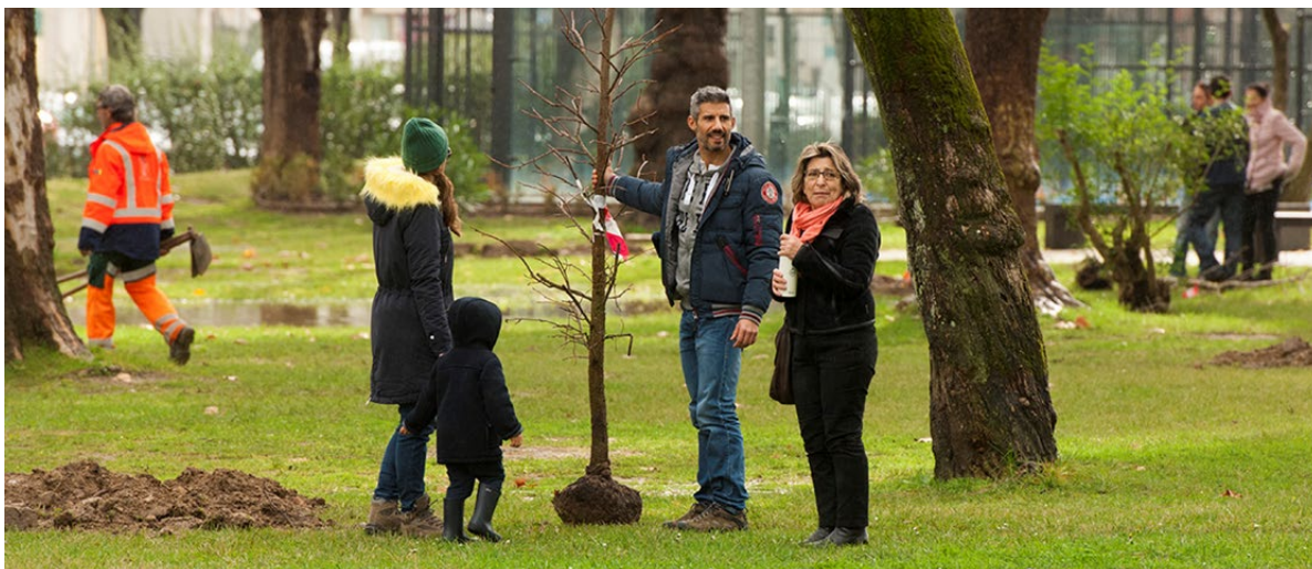
Figura 5 - Plantações de árvores em Lisboa.