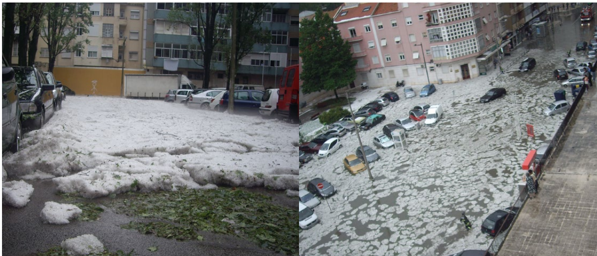
Figura 3 - Fenómenos meteorológicos extremos ocorridos na última década em Portugal.

Lisboa, pela sua localização geográfica, é um território vulnerável às alterações climáticas. A sua proximidade do rio torna a cidade vulnerável a fenómenos de cheias e à subida do nível médio das águas do mar. As projeções climáticas para Lisboa até ao final do século apontam, entre outros cenários, para uma potencial diminuição anual do número de dias com precipitação, bem como um aumento da frequência de eventos de precipitação intensa ou muito intensa, acompanhada de ventos fortes com rajadas. Os cenários projetados apontam também para um aumento das temperaturas (mínima, média e máxima), em particular das máximas durante o outono, e ainda a um aumento da frequência de ondas de calor.