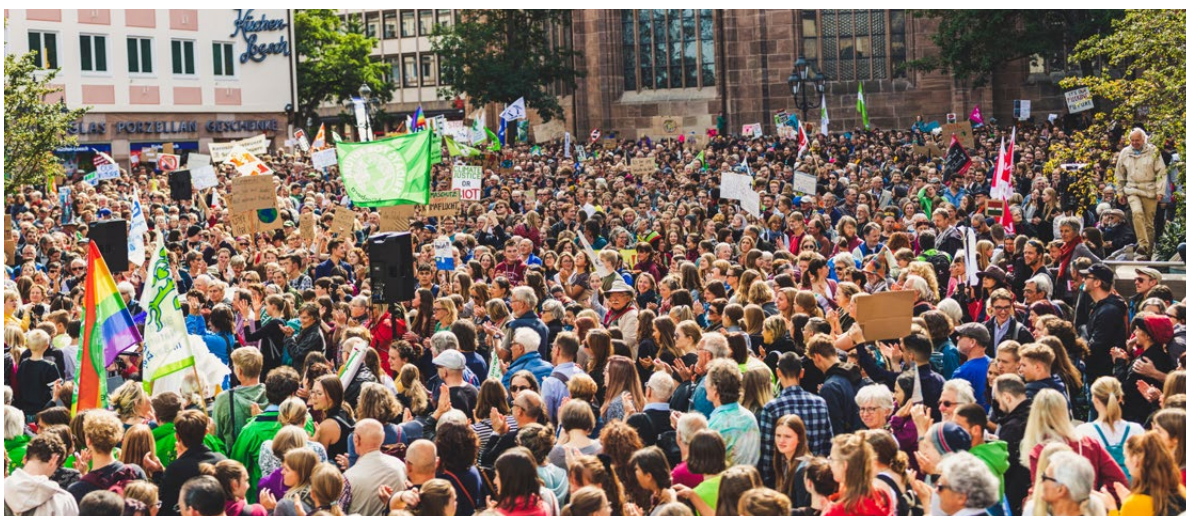
Figura 1 - Greve Climática Global 20-09-2019 (Nuremberga, Alemanha)

As alterações climáticas são consideradas um dos maiores desafios deste século, com consequências profundas no planeta e na sociedade, ameaçando o desenvolvimento sustentável, e agravando problemas como a pobreza, as desigualdades, o acesso à educação e à saúde, assim como a escassez de recursos. Terão, como uma das suas manifestações mais visíveis, a ocorrência com maior frequência e intensidade de eventos climáticos extremos. Podem significar um aumento da temperatura média, subida do nível médio do mar, ondas de calor, cheias, secas e outros fenómenos meteorológicos extremos.