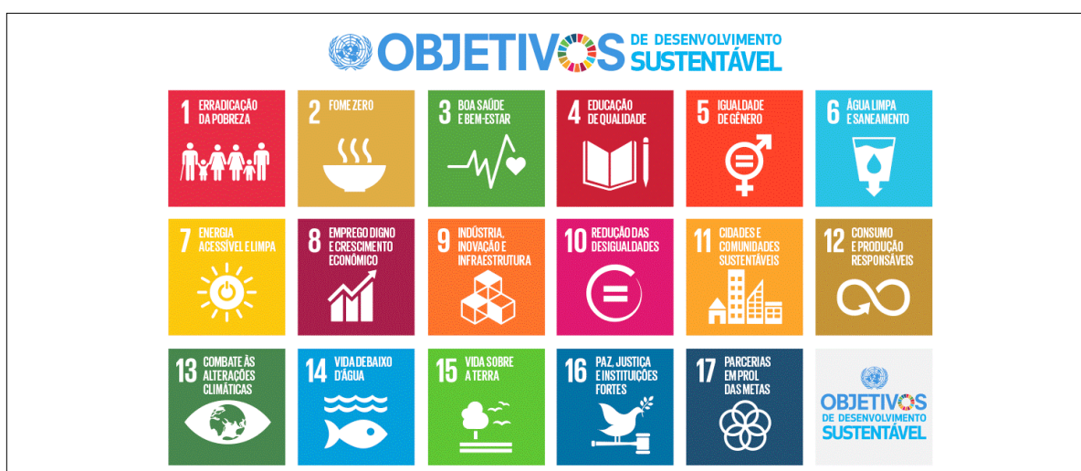
Figura 2 - Objetivos de Desenvolvimento Sustentável.

O primeiro período de compromisso desenrolou-se de 2008 a 2012. Em 2012 foi proposta uma extensão para o período de 2012 a 2020, na Emenda de Doha, na qual 37 países assumiram metas obrigatórias. No entanto, a Emenda de Doha nunca entrou em vigor por não ter sido ratificada por um número suficiente de países.