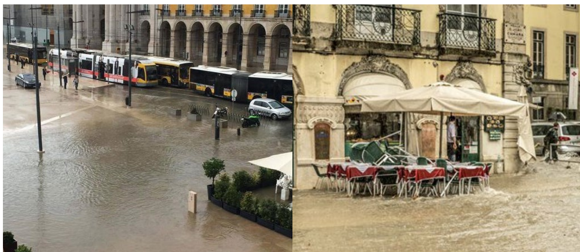
Figura 4 - Fenómenos de precipitação intensa em Lisboa.

No contexto dos compromissos internacionais, e alinhado com as políticas nacionais, preconizadas na Estratégia Nacional de Adaptação às Alterações Climáticas 2020 (ENAAC 2020), o município de Lisboa tem vindo a adotar medidas de mitigação e adaptação. São exemplos de medidas de mitigação a promoção de um sistema de mobilidade baseado nos transportes públicos e nos modos suaves, bem como a promoção de eficiência energética e energias renováveis. Do lado da adaptação destacam-se a concretização de corredores ecológicos, como forma de combate ao aumento da temperatura; e as soluções de base natural, aliadas ao Plano Geral de Drenagem, para combater as inundações. «Lisboa - Cidade resiliente às Alterações Climáticas: preparada para o futuro, adaptada no presente» foi a visão estratégica adotada pelo município de Lisboa no âmbito da Estratégia Municipal de Adaptação às Alterações Climáticas (EMAAC 2017). O Plano de Ação de Energia Sustentável e Clima (PAESC 2018) estende esta visão assumindo a neutralidade carbónica em 2050.